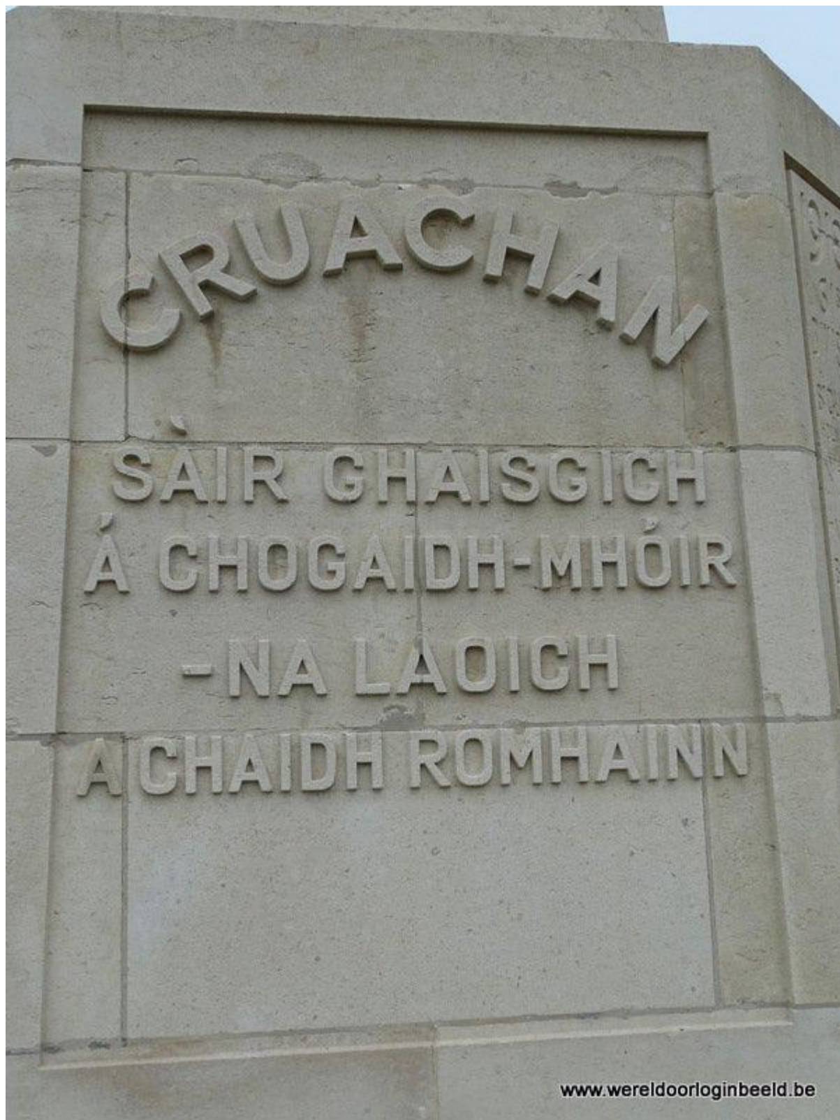
Tekst: infoboekje Fronttour: Friends of World War 14-18